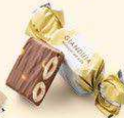
Nougat au miel

LA BOITE EN MÉTAL 260 G NET 28 GIANDUJAS AUX DEUX NOISETTES 4 recettes assorties