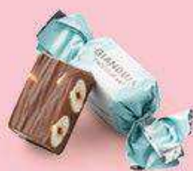
Chocolat au lait

La sublime rencontre entre le plus fin, le plus fondant, le plus onctueux des pralinés et le croquant de deux noisettes torrifiées. Tout simplement irrésistible !